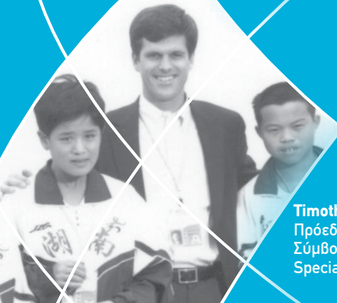
Timothy P. Shriver Πρόεδρος & Δ/νων Σύμβουλος Special Olympics