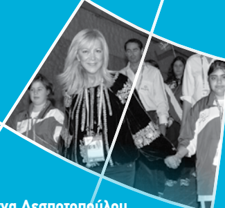
Γιάννα Δεσποτοπούλου Πρόεδρος Special Olympics Ελλάς & Ο.Ε Παγκοσμίων Αγώνων Special Olympics ΑΘΗΝΑ 2011